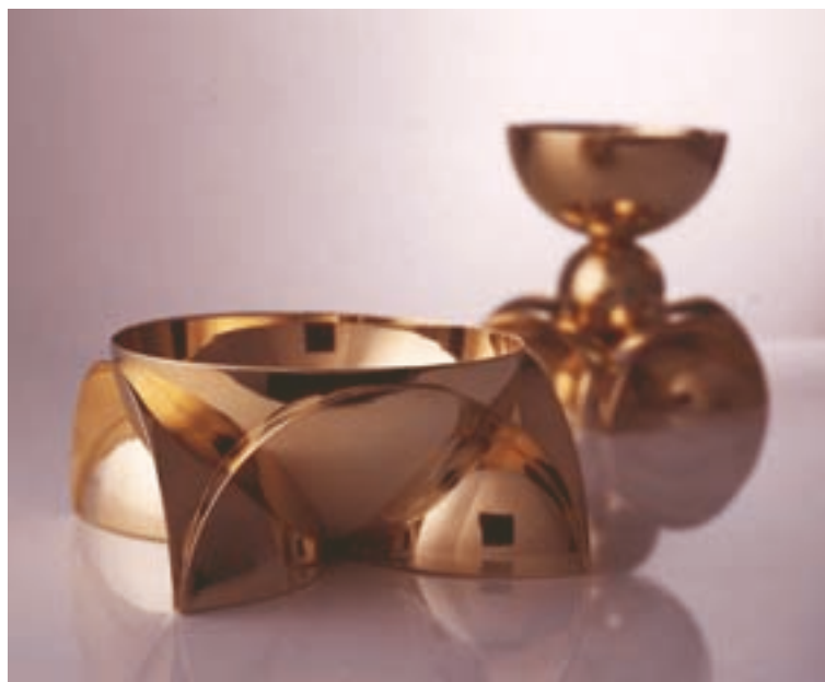
■ Obětní miska patří ke Štěpánově sakrální tvorbě.