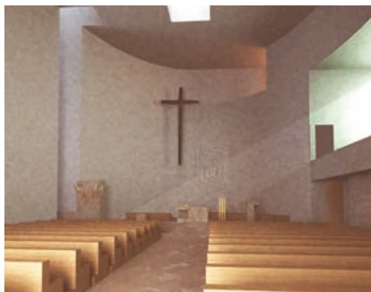
■ Návrh interiéru kostela v Ostravě – Zábřehu.