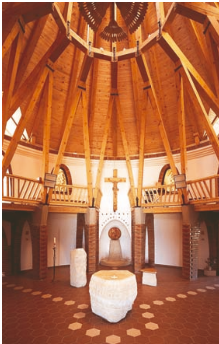
■ Kompozice kaple v Zubří směřuje k vrcholu.

Narozen 1967 ve Frýdku-Místku, 1985-1991 studium na Fakultě architektury VUT v Brně, specializace novotvar. 1997 zahajuje činnost Atelier Štěpán jako vlastní autorský projekt. Od 2005 dodnes – externí výuka na VUT Brno. Hlavní oblasti tvorby jsou bydlení a sakrální architektura. Z ocenění: Český interiér roku 2006 – Cena UVU ČR - Kostel sv. Kateřiny v Ostravě-Hrabové, Cena Klubu Za starou Prahu za novostavbu v historickém prostředí 2005 – nominace – Věž kostela sv. Floriana v Kozmíciích, Český interiér roku 2005 – Cena UVU ČR - Kostel sv. Václava v Ostravě, Cena Top Design Profiinteriéry Praha 1999 – Komoda Noce, Cena Design centra ČR 1995 - Bar Scala, Brno. Z realizací: kostel Ostrava – Zábřeh – ve výstavbě, vila Silesia – Komárovské Chaloupky – ve výstavbě, kanceláře a vzorkovna firmy Le Bon (2005), kostel sv. Kateřiny v Ostravě – Hrabové – 2005, kostel sv. Václava v Ostravě – rekonstrukce (2004), penzion Havelský trh, Praha (2004), vila Břevnov, Praha (2004), oranžerie Drnovce (2003), vinná galerie Brno (2003).