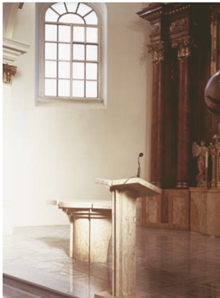
■ Do kostela v Petřvaldě byl včleněn novotvar obětního stolu.

Převážně pocitem. Intuicí hledám výsledný tvar, formu. U rekonstrukcí mne například velice láká vytvořit novotvar v historickém prostředí. Taková je například mensa a křtitelnice v obnoveném kostele sv. Kateřiny v Ostravě – Hrabové nebo obětní stůl v kostele v Petřvaldu u Nového Jičína. Z interiéru tohoto barokního, architektonicky nepříliš vzácného kostela mělo být vyhozeno vše z presbytáře a nahrazeno novým. Když jsem se předsvědčil o řemeslné kvalitě zpracování původních prvků a mobiliáře, musel jsem proti takovému radikálnímu zásahu protestovat. Ponechali jsme původní barokní oltářní kompozici a k ní vymysleli již neexistující sokl. Z tvarosloví původního oltáře je dopředu vytažený tvarově podobný „otisk“ obětního stolu. Sokl i stůl jsou z umělého mramoru, pouze horní deska je